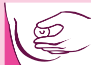
Presiona tu pezón entre los dedos

PASO 3 Recuéstate colocando una almohada bajo el hombro izquierdo, con el brazo levantado y pasa tu mano bajo la cabeza.